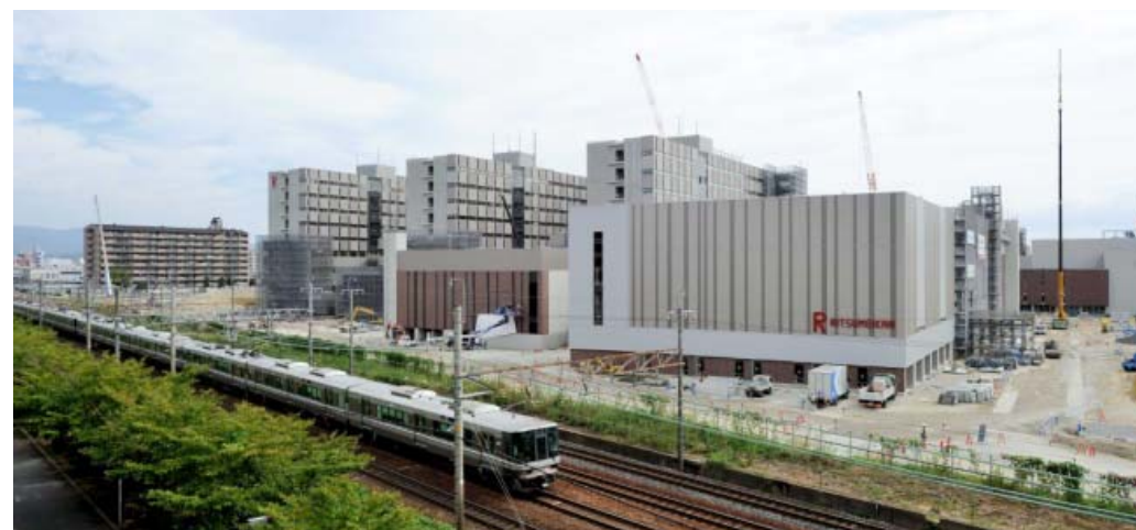
* 立命館大学(2015年4月開校予定)