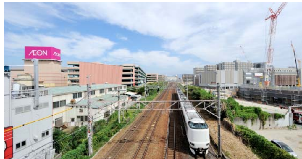
* イオン茨木SC(左側)と立命館大学(右側)